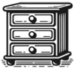
Chest of Drawers