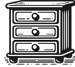
Chest of Drawers