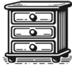
Chest of Drawers