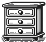
Chest of Drawers